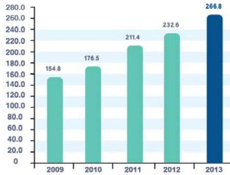
نمو صافي أرباح سبيماكو (2013-2009) (بملايين الريالات)