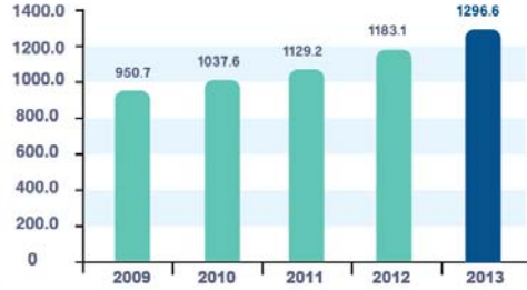
نمو إيرادات سبيماكو (2013-2009) (بملايين الريالات)