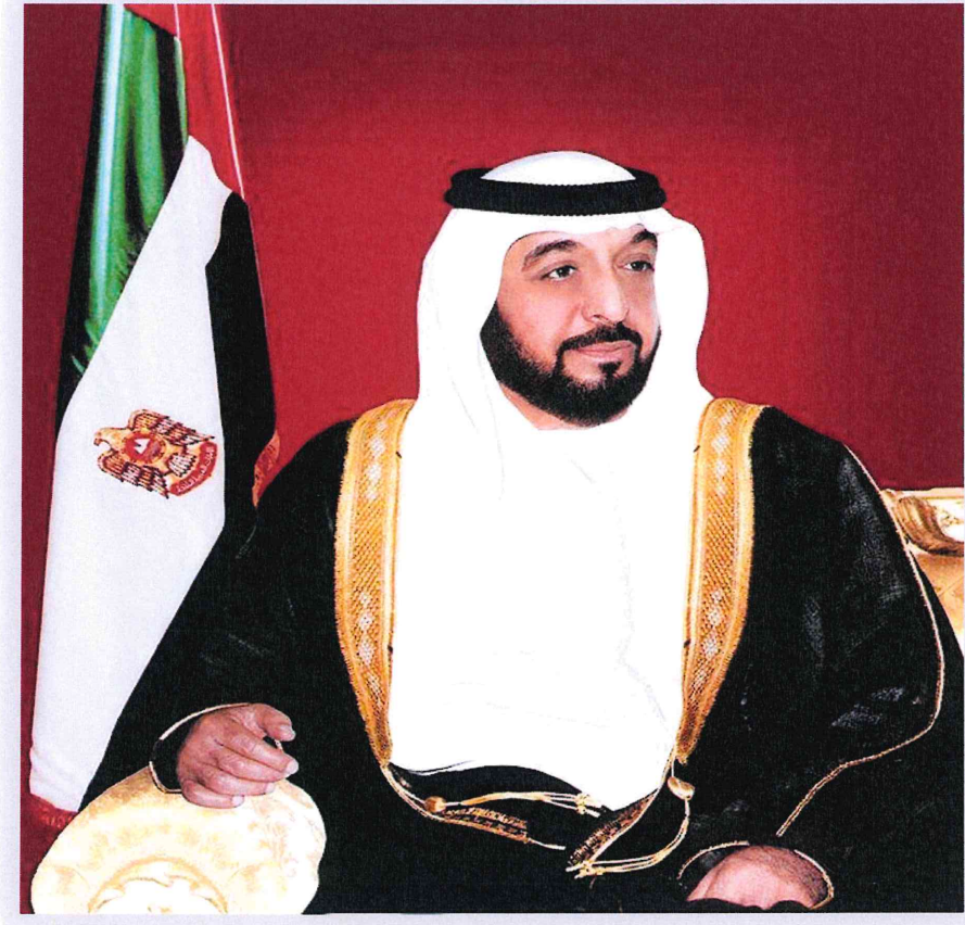
صاحب السمو الشيخ خليفة بن زايد آل نهيان رئيس دولة الامارات العربية المتحدة القائد الأعلى للقوات المسلحة حاكم إمارة أبوظبي

الخليج الإستثمارية ش.م.ع. AL KHALEEJ INVESTMENT P.J.S.C