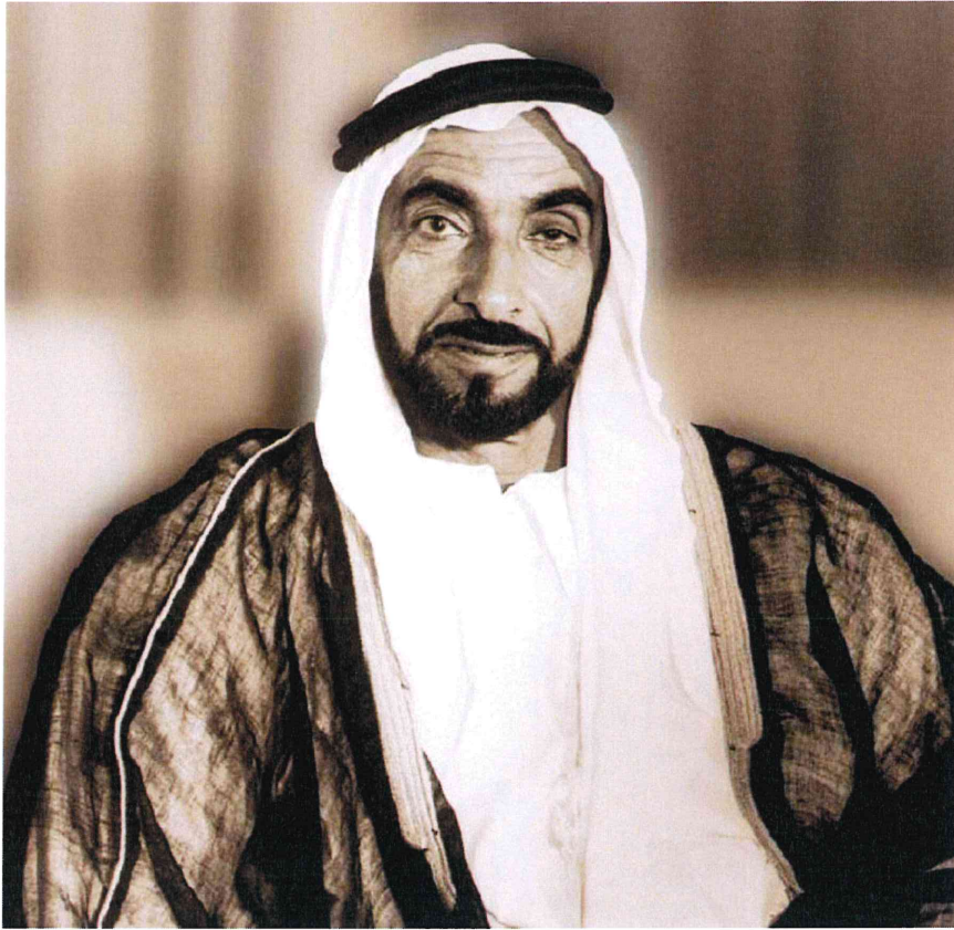
المغفور له بإذن الله الشيخ زايد بن سلطان آل نهيان

الخليج الإستثمارية ش.م.ع AL KHALEEJ INVESTMENT P.J.S.C