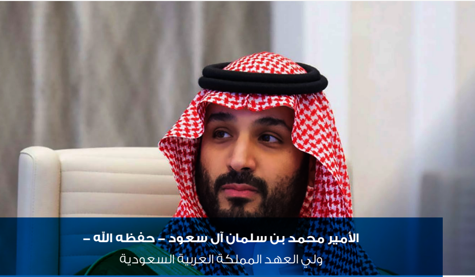
الأمير محمد بن سلمان آل سعود - حفظه الله - ولي العهد المملكة العربية السعودية

” يسرني أن أقدم لكم رؤية الحاضر للمستقبل، التي نريد أن نبدأ العمل بها اليوم للغد، بحيث تعبر عن طموحاتنا جميعاً وتعكس قدرات بلادنا.