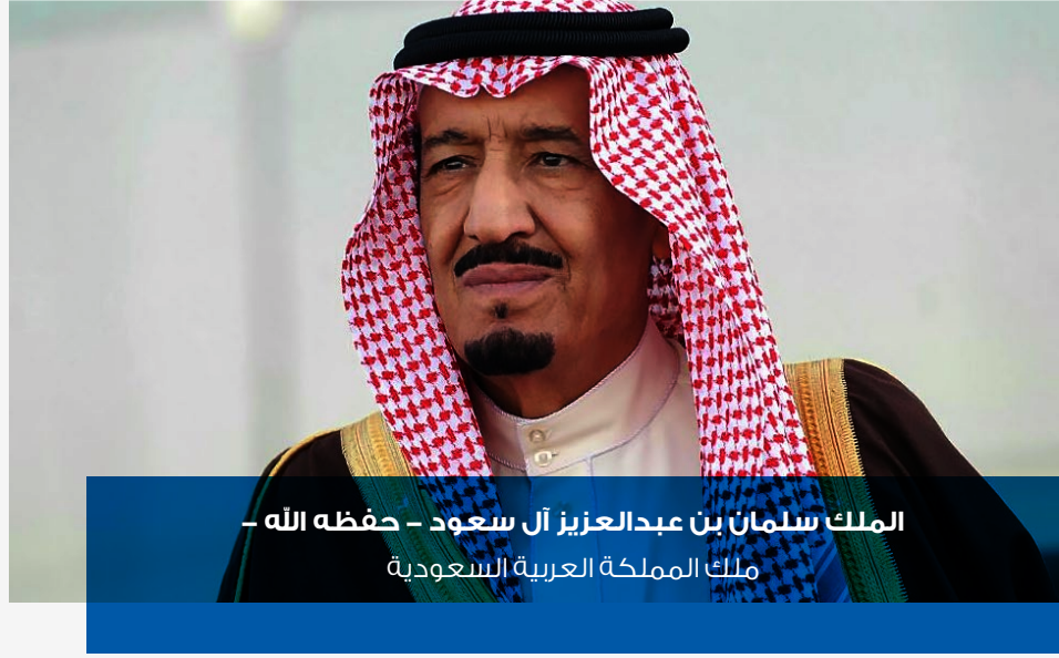
الملك سلمان بن عبدالعزيز آل سعود - حفظه الله - ملك المملكة العربية السعودية

” هدفي الأول أن تكون بلادنا نموذجاً ناجحاً ورائداً في العالم على كافة الأصعدة، وسأعمل معكم على تحقيق ذلك.