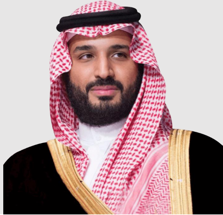
صاحب السمو الملكي

الأمير محمد بن سلمان بن عبدالعزيز آل سعود