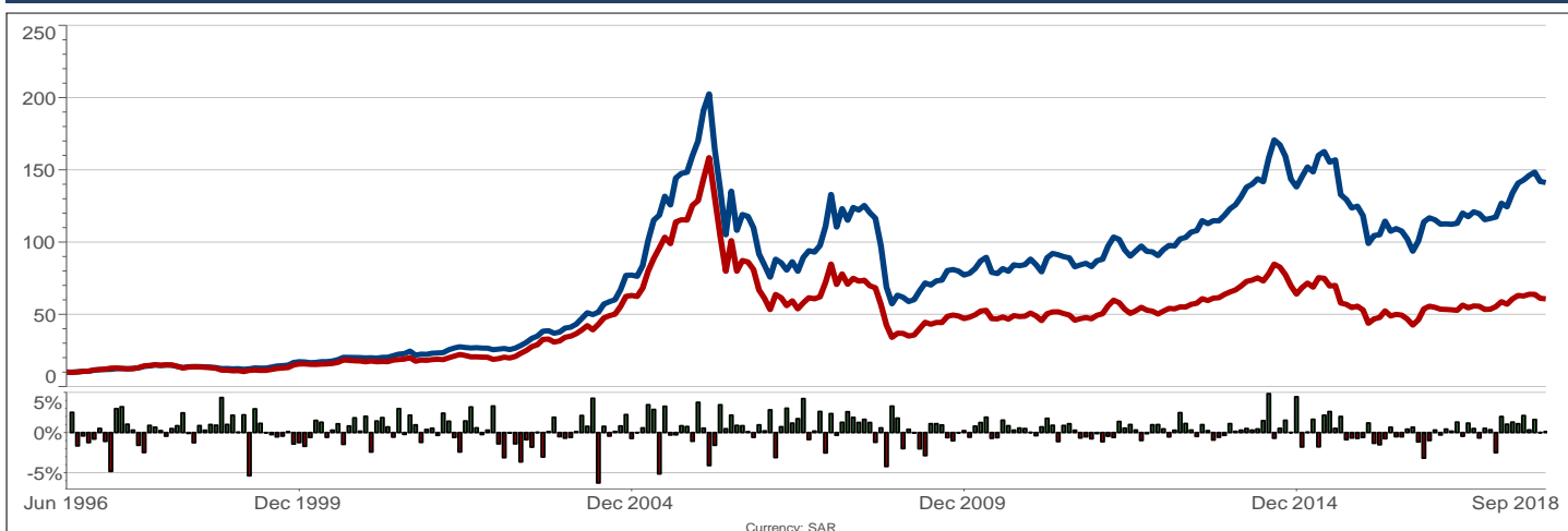
الانحراف عن المؤشر

الاداء الشهري التراكمي ■ الصندوق ■ المؤشر