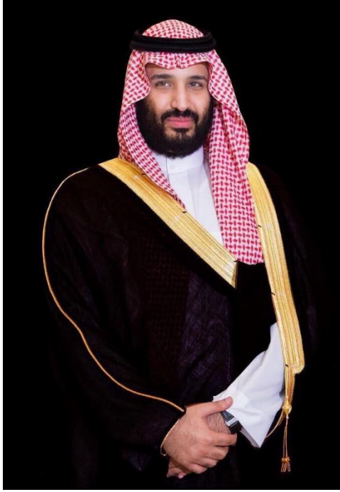
صاحب السمو الملكي الأمير