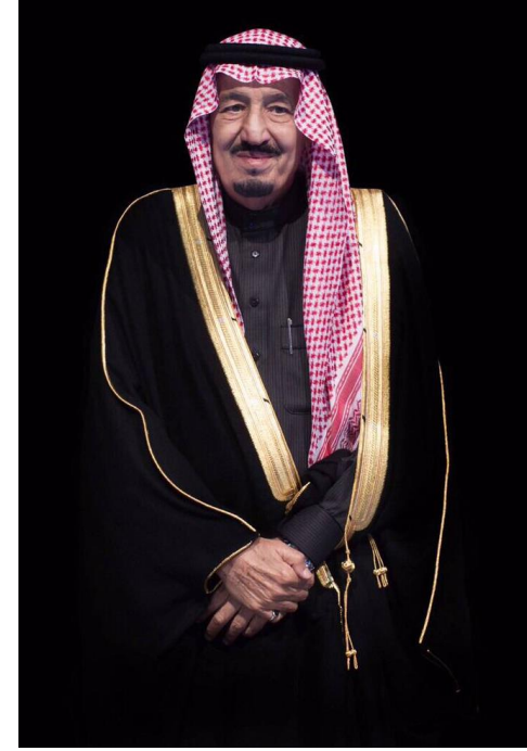
فادم الحرمين الشريفين الملك