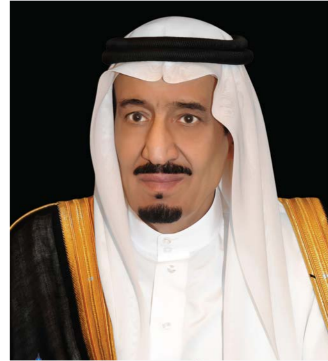
خادم الحرمين الشريفين الملك سلمان بن عبدالعزيز آل سعود