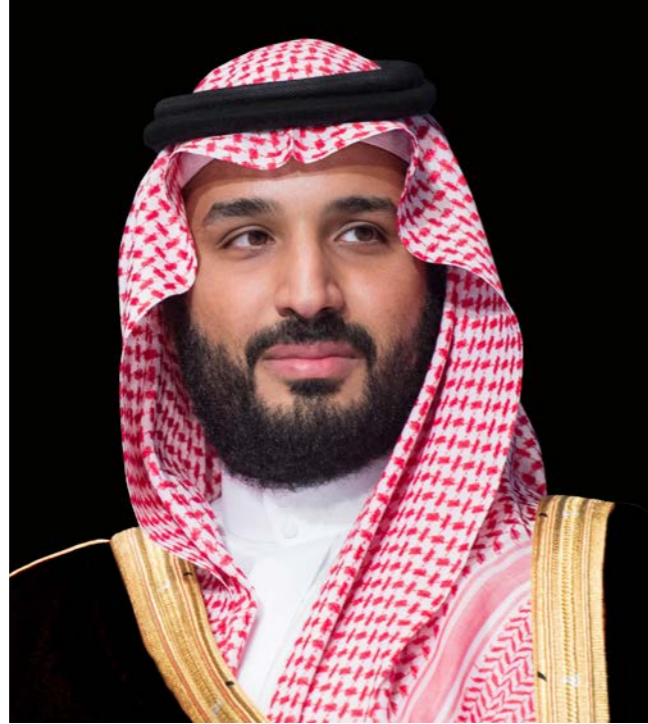
صاحب السمو الملكي الأمير محمد بن سلمان بن عبدالعزيز آل سعود