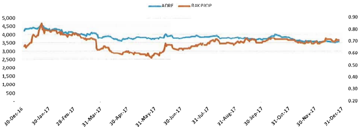
Company's Share Price Compared to the Sector Index