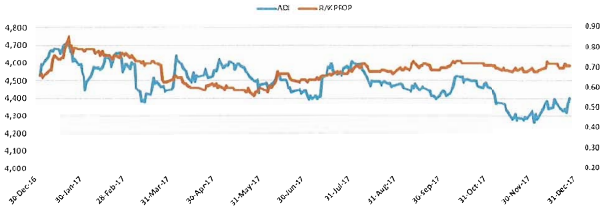
Company's Share Price Compared To the Market Index