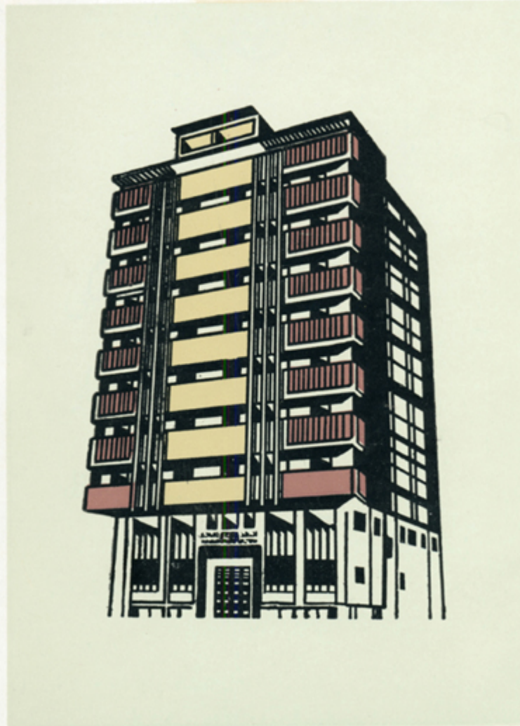
صورة مقر الادارة العامة والمركز الرئيسي للبنك في جدة VIEW OF JEDDAH HEAD OFFICE BUILDING