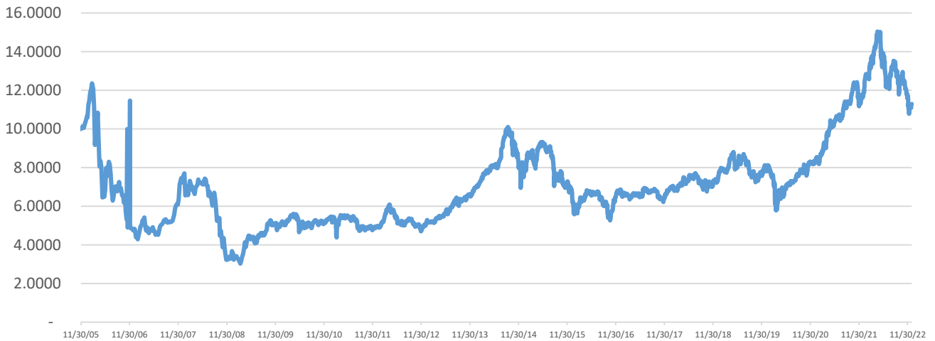
سعر وحدة الصندوق منذ الانشاء بالريال السعودي