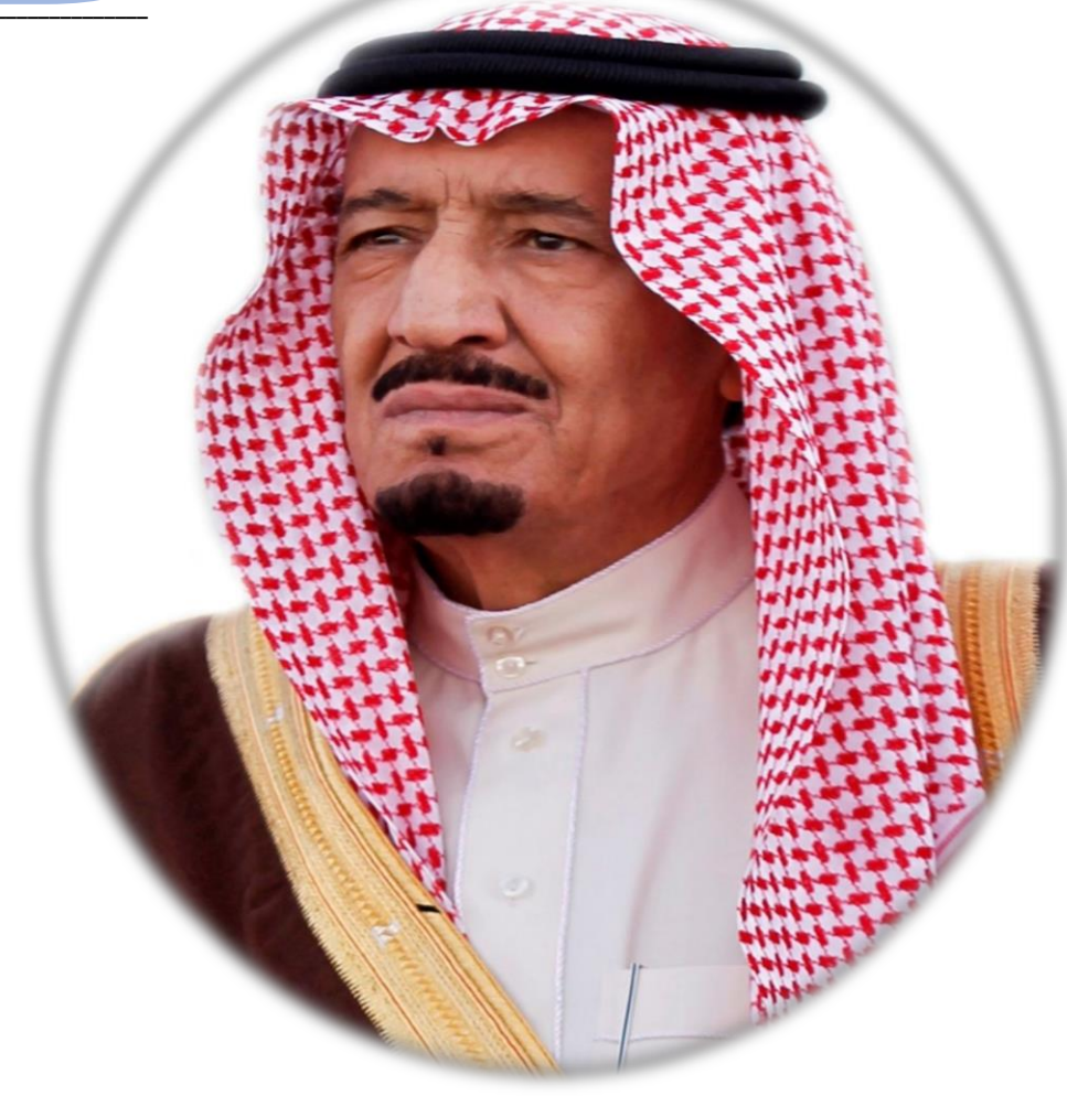
خادم الحرمين الشريفين الملك سلمان بن عبدالعزيز حفظه الله

تعد المملكة العربية السعودية أحد أهم وأكبر اقتصادات العالم ونسعى بجدية للعمل على مضاعفة حجم الاقتصاد.