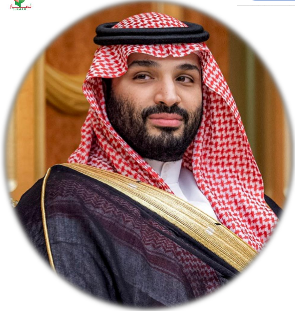
بسمو ولي العهد الأمير محمد بن سلمان حفظه الله

تعد المملكة العربية السعودية أحد أهم وأكبر اقتصادات العالم ونسعى بجدية للعمل على مضاعفة حجم الاقتصاد.