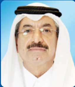
سعادة الشيخ عبد الرحمن بن محمد بن جبر آل ثاني العضو المنتدب