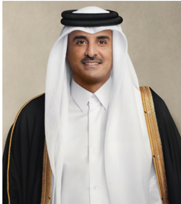
حضرة صاحب السمو الشيخ تميم بن حمد آل ثاني أمير البلاد المفدى