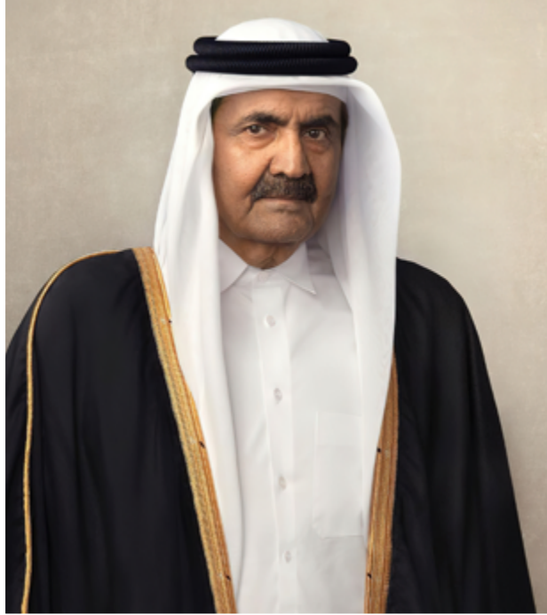
حضرة صاحب السمو الشيخ حمد بن خليفة آل ثاني الأمير الوالد