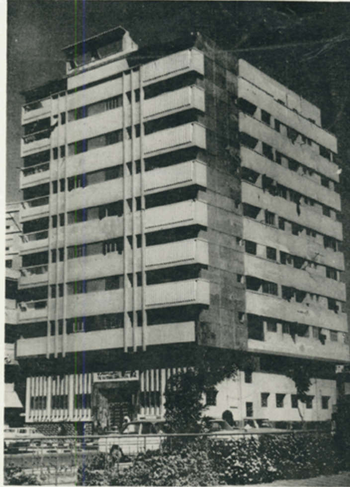
صورة مقر الادارة العامة والمركز الرئيسي للبنك في جدة