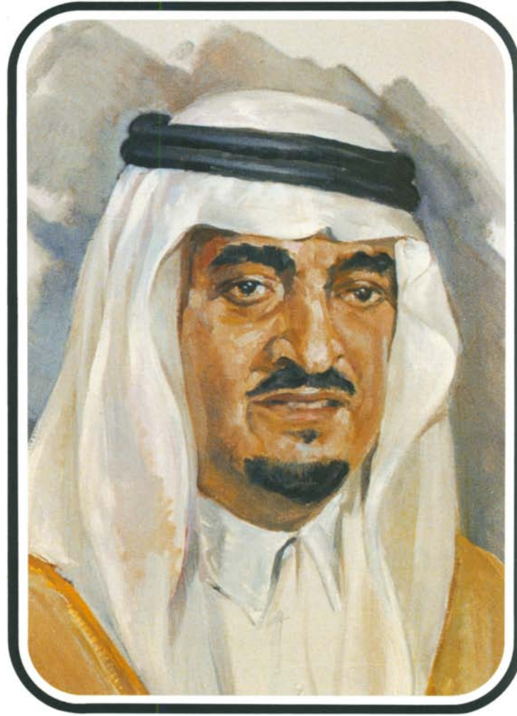
حضرة صاحب السمو الملكي الأمير فخر بن عبد العزيز