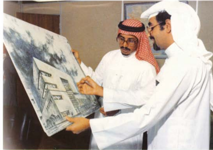
مشروع الإدارة الإقليمية ، المنطقة الشرقية

وكذلك يتيح للبنك امكانية ان تظل خدمة الكمبيوتر متوافرة ومتاحة لفروعه وعملائه