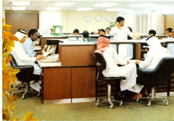
غرفة القبول الأجنبي ، مبنى فرع المدينة - جدة

لقد انتهى العمل في مبنى الإدارة الإقليمية بالرياض حيث تنقل الإدارة المذكورة الى مبناها الجديد خلال هذا العام بينما يسير العمل قدما في عدد من مباني البنك حيث نفذ من فرع ابها ثلاثة ادوار وجرى العمل فيه حسب البرنامج المخصص وقد بدأ العمل في مبنى المدينة المنورة منذ شهر رمضان ١٤٠١ هـ ويتوقع انتهاء العمل منه في نهاية شهر شعبان ١٤٠٣ هـ