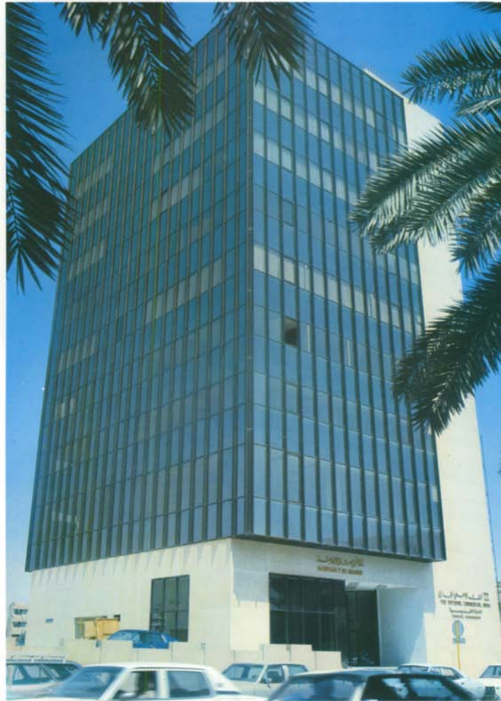
مبنى الإدارة الإقليمية بالرياض