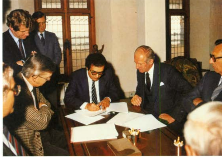
توقيع اتفاق بين مدير فرع طريق المعطارية لربطها وإحدى الشركات العالمية

الخدمات بمصادرنا البشرية ، وذلك من أجل صيانة واستمرارية تقديم اكفا الخدمات لعملائنا .