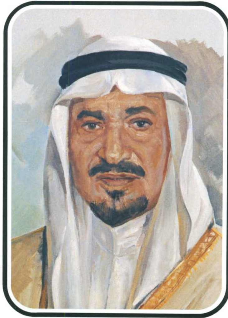
حضرة صاحب الجلالة الملك خالد بن عبد العزيز