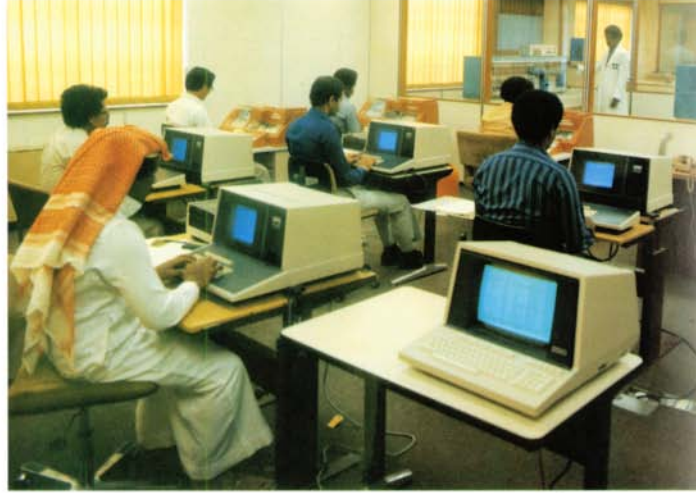
مركز الحاسب الآلي (الكمبيوتر) جدة

كان أكبر فعالية ، وكذلك تقييم التعويضات الآخرى . وإن إدخال الكمبيوتر لاعداد سجلات الموظفين سوف يزودنا بأسرع الطرق وكفاً المعلومات ولقد كان لتغيير طريقة اداء الموظفين السنوى الى الطريقة الجديدة النجاح التام ، وقد نتج عن ذلك اعداد توزيع التقييم السنوى الذى كان أكثر موضوعية وملائمة .