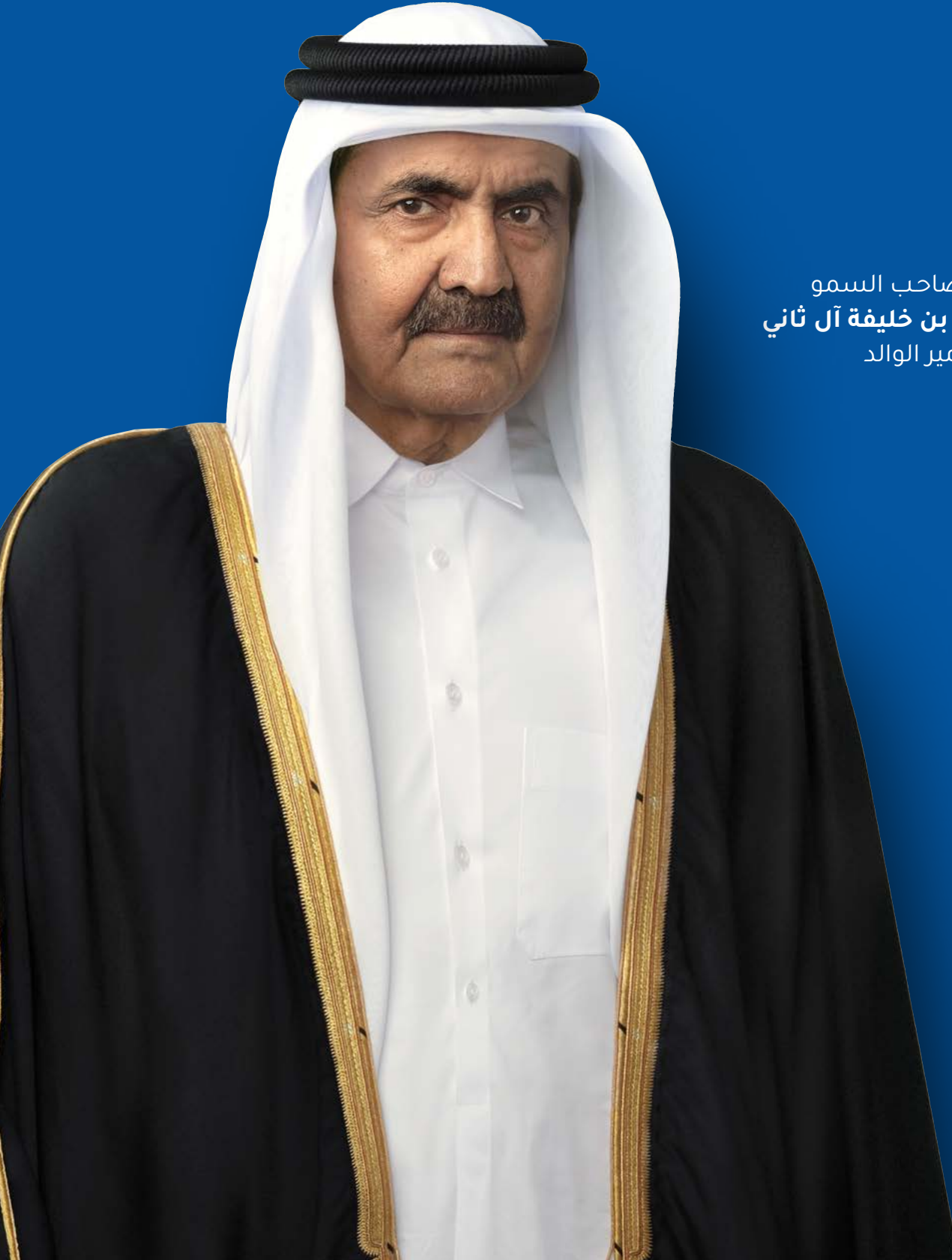
حضرة صاحب السمو الشيخ حمد بن خليفة آل ثاني الأمير الوالد