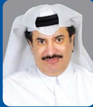
سعادة الشيخ فلاح بن جاسم بن جبر آل ثاني