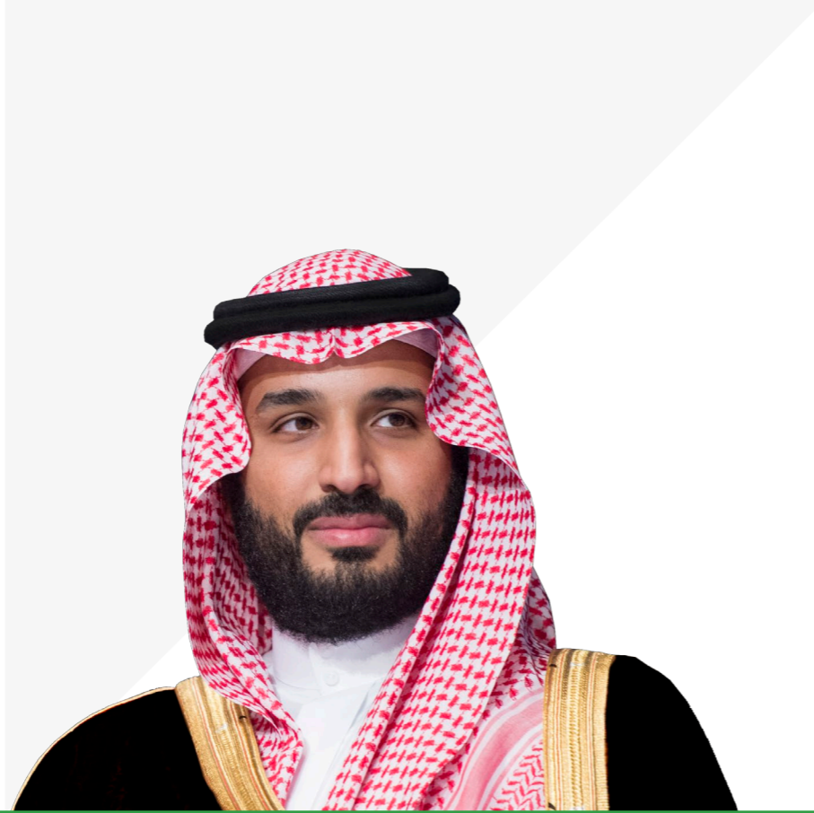
صاحب السمو الملكي الأمير محمد بن سلمان بن عبدالعزيز آل سعود ولي العهد، نائب رئيس مجلس الوزراء، ووزير الدفاع