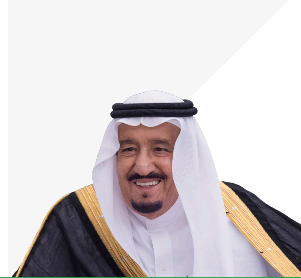
خادم الحرمين الشريفين الملك سلمان بن عبد العزيز آل سعود ملك المملكة العربية السعودية