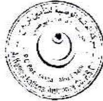
الشيخ / سيف بن محمد بن بazzi آل حامد رئيس مجلس الإدارة