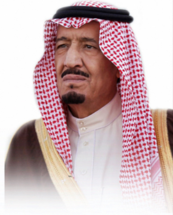
خادم الحرمين الشريفين الملك سلمان بن عبدالعزيز