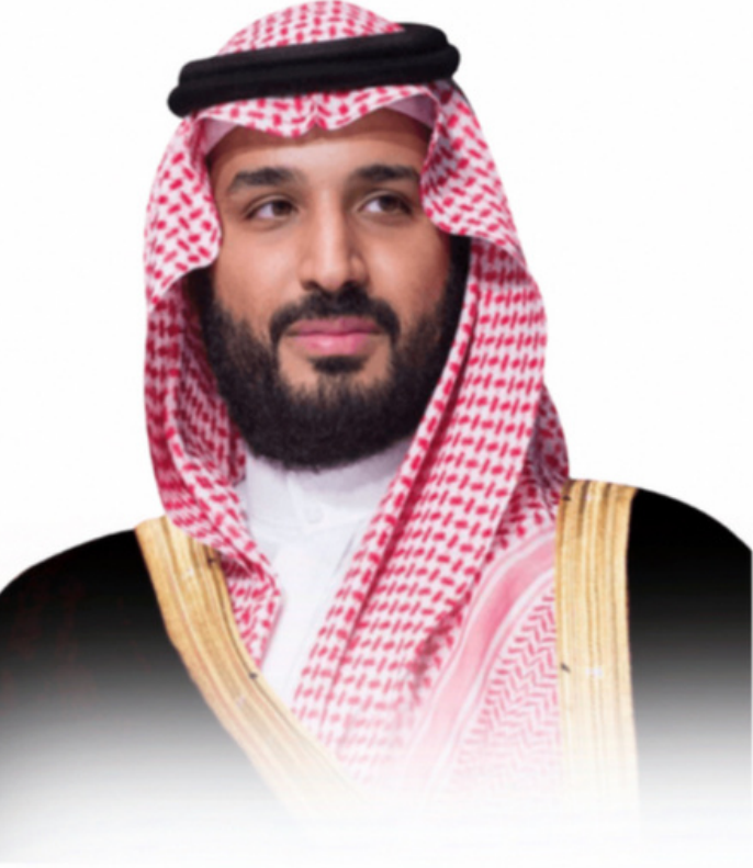
ولي العهد الأمير محمد بن سلمان