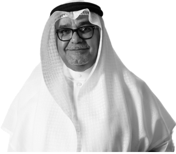
العضو المنتدب والرئيس التنفيذي